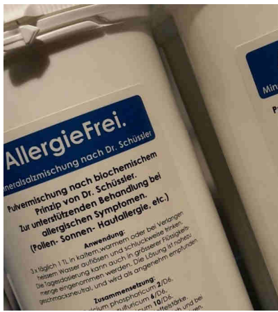
Hilft gut bei allergischen Beschwerden! Schüssler Mischung AllergieFrei.